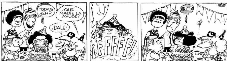
El 15 de marzo de 1966 Quino festeja el primer aniversario de Mafalda en el diario "El Mundo", al mismo tiempo que en la ficción el personaje cumple seis años.